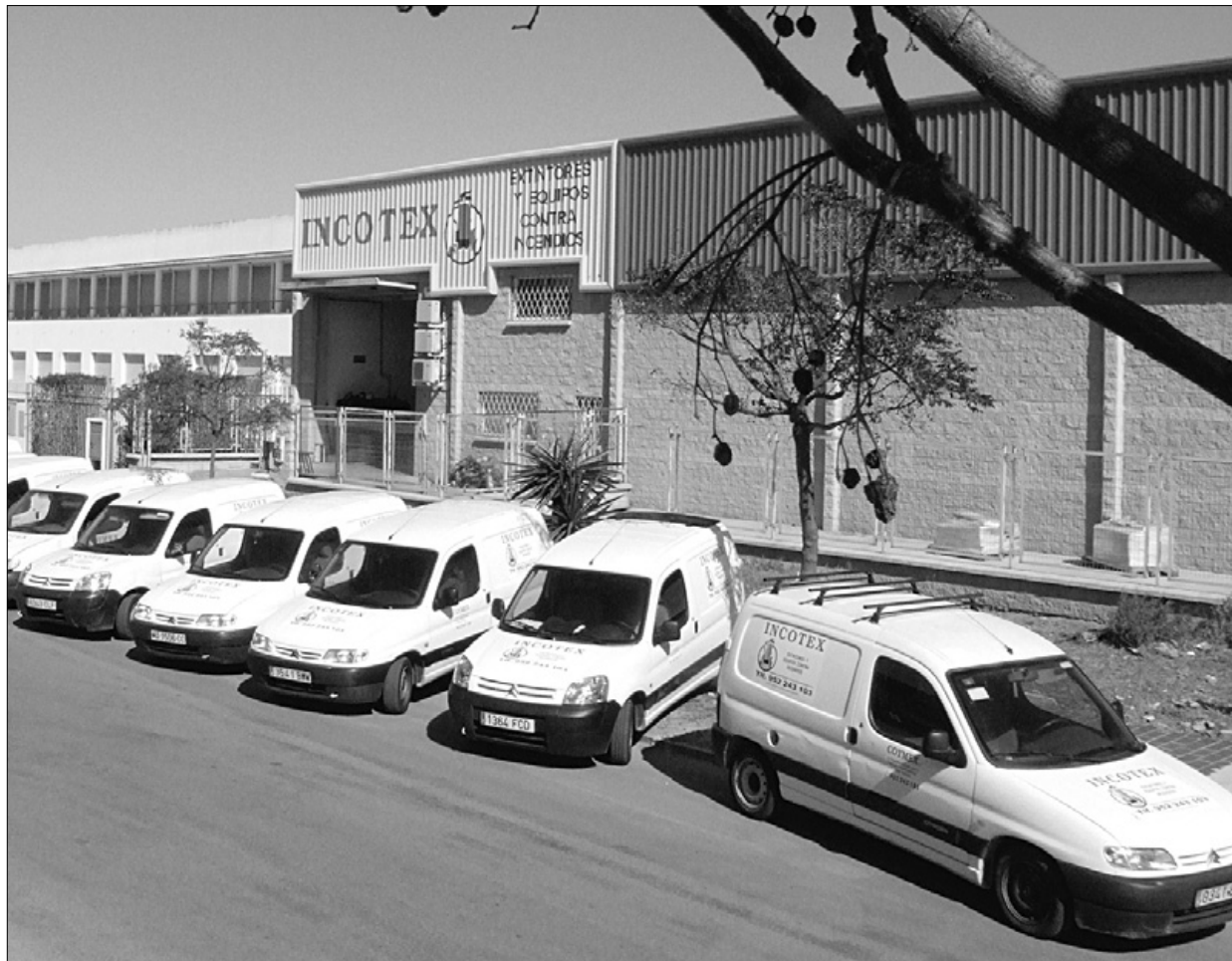
Sede. Instalaciones de Incotex en el Polígono del Guadalhorce.