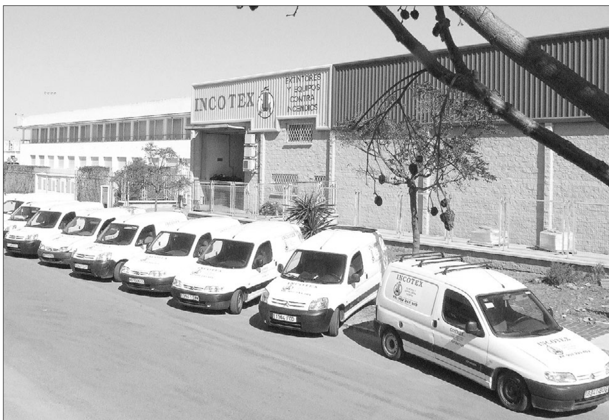
Empresa. Fachada y flota de automóviles de Incotex.

Uno de los factores que distinguen a Incotex de otras empresas es que se